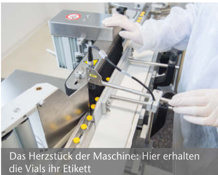
Das Herzstück der Maschine: Hier erhalten die Vials ihr Etikett

Med-X-Press bietet das Sleeve von Vials als Dienstleistung an. Jetzt wurde dieser Service für Ihre Produkte um einen weiteren validierten Prozess erweitert: das Etikettieren von Vials. Mit dem geschulten Personal, das die Maschine bestückt und die Endkontrolle durchführt, können pro Stunde bis zu 6.000 Vials etikettiert werden. Med-X-Press verarbeitet sowohl Blankoetiketten, die vor Ort bedruckt werden, als auch vorgedruckte Label.