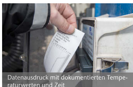
Datenausdruck mit dokumentierten Temperaturwerten und Zeit

temperaturgeführte Güter 15 °C bis 25 °C eingesetzt. Die Kontrolldaten können ausgedruckt, per DFÜ ins IT-Netzwerk eingespeist oder per USB-Anschluss übertragen werden.