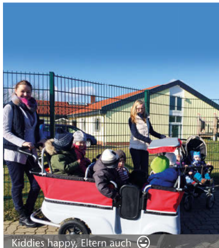
Kiddies happy, Eltern auch 😊

Die von Goslarer Unternehmen initiierte Kindertagespflege „Bassgeigenflöhe“ entwickelt sich prächtig! Kürzlich meldete der Verein, dass alle zehn Plätze der neuen Gruppe bereits belegt sind. Pünktlich zum Start war die Renovierung von bisher nicht genutzten Räumen abgeschlossen. Außerdem kann über einen weiteren schönen „Nebeneffekt“ berichtet werden: um die kleinen Neuflöhe kümmern sich drei zusätzliche Betreuerinnen.