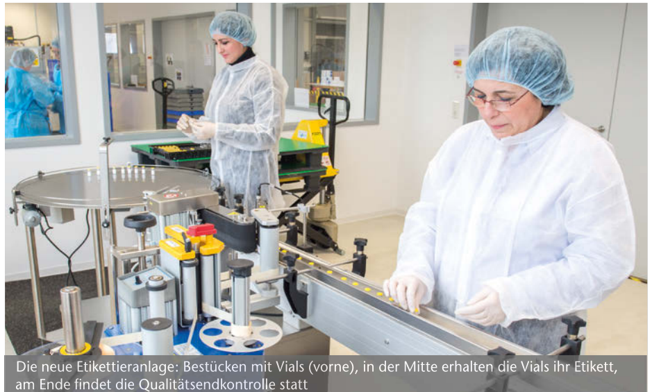
Die neue Etikettieranlage: Bestücken mit Vials (vorne), in der Mitte erhalten die Vials ihr Etikett, am Ende findet die Qualitätsendkontrolle statt

Alle Daten und Prozessschritte werden einer laufenden Begutachtung durch den Leiter der Qualitätskontrolle unterzogen – von der Frei-