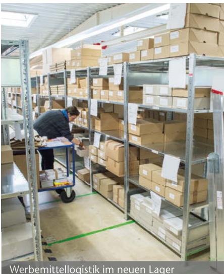
Werbemittellogistik im neuen Lager