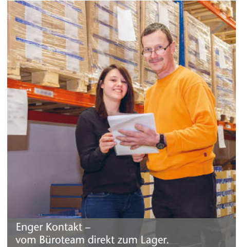
Enger Kontakt – vom Büroteam direkt zum Lager.

Sachbearbeitung in den Teams, die permanent geschult werden und bei Änderungen ad hoc Unterweisungen erhalten.