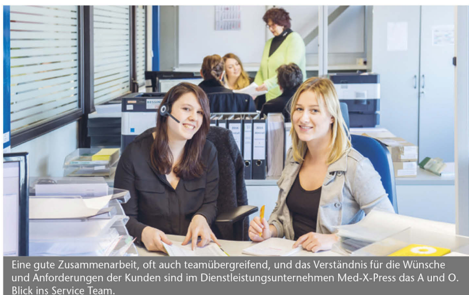
Eine gute Zusammenarbeit, oft auch teamübergreifend, und das Verständnis für die Wünsche und Anforderungen der Kunden sind im Dienstleistungsunternehmen Med-X-Press das A und O. Blick ins Service Team.

Service-Qualität stellt einen wichtigen Faktor im Rahmen einer kundenorientierten Unternehmensstrategie dar, dessen Erfolg am Grad der Erfüllung von Kundenerwartungen gemessen wird. So steht es in den Lehrbüchern. In der täglichen Praxis bei Med-X-Press heißt die Formel: hohe Servicequalität gleich hohe Kundenzufriedenheit.