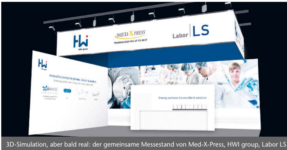
3D-Simulation, aber bald real: der gemeinsame Messestand von Med-X-Press, HWI group, Labor LS.

Med-X-Press auf CPhI worldwide – „Wollen uns internationaler aufstellen“