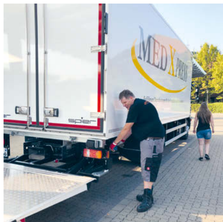
...für einen guten, logistischen Radlerzweck.