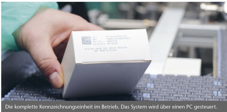
Die komplette Kennzeichnungseinheit im Betrieb. Das System wird über einen PC gesteuert.

Die EU-Fälschungsschutz-Richtlinie ist noch immer in der Diskussion. Mitte September hat die EU-Kommission die bislang 16. Version ihrer FAQ zur Richtlinie und zur Delegierten Verordnung veröffentlicht, die zwar keine rechtlich verbindlichen Angaben darstellen, aber wichtige Punkte differenzieren.