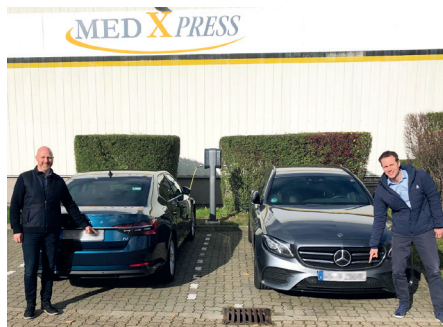
Neue Hybrid- und eFahrzeuge im Fuhrpark „Wir werden (teil-) elektrisch“ » Seite 4