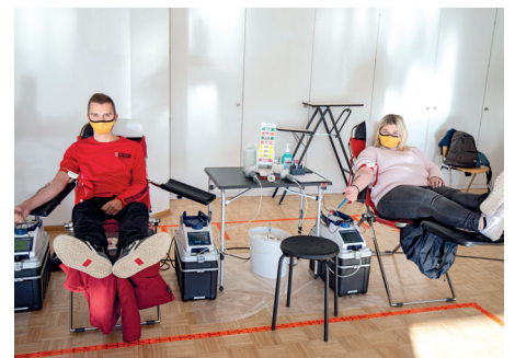
Aderlass für einen guten Zweck Blutspendenaktion bei Med-X-Press » Seite 4