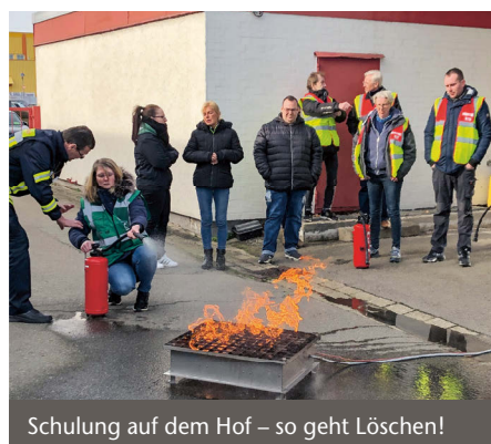
Schulung auf dem Hof – so geht Löschen!

werden insgesamt 24 kompetente Brandschutzhelfer/innen im Brandfall besonnen und vorschriftsmäßig agieren.