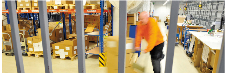
Blick ins mehrfach gesicherte und videokontrollierte BtM-Lager.

als BtM-Spezialist Kunden mit Service-Leistungen rund um die Betäubungsmittel-Logistik.