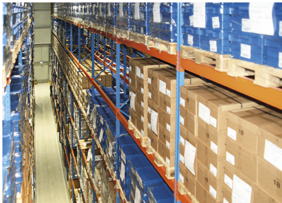
GDP-gerechtes Hochregallager bei Med-X-Press.