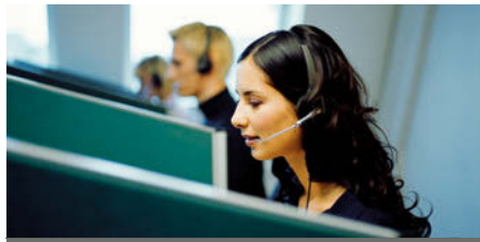
eShop-Service: automatisierte Anschreiben.

Personalisierte Anschreiben können bei Med-X-Press automatisiert über den eShop generiert werden (siehe auch Pharma-Logistik-Brief Nr. 6, Januar 2012). In Zusammenarbeit mit seinem Partner pdv-Software, Goslar, hat Med-X-Press dafür das webbasierte Verfahren für den Vertriebsinnendienst weiterentwickelt: Bereits während eines Telefonats aus dem Service-Center eines Pharmaunternehmens mit Ärzten oder Apotheken werden die jeweiligen Informationen mit personalisiertem Bezug im Shop erfasst. Beim Abschluss der Bestellung kann der Nutzer dann über eine entsprechende Option ein personalisiertes Anschreiben mit Freitext hinzufügen, welches aus einer Liste mit derzeit acht bereitgestellten